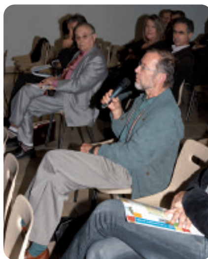
Questions ou témoignages, de nombreuses interventions sont venues nourrir les débats.