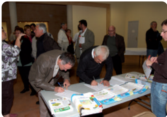
Accueil des participants et remise de documents d'information. Magalas, 08/10/2008.