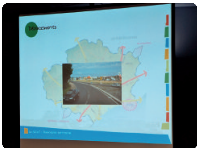
Projection d'un diaporama pour présenter le diagnostic territorial du Biterrois.